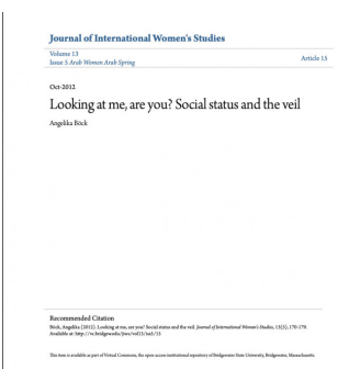
Publikationen Looking at me, are you? Social status and the veil 2012, Artikel, Eigene Schrift