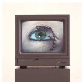
arbeiten eye2eye 2000, Videoinstallation, Eye-tracking