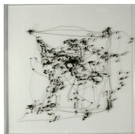
arbeiten Blanks 1996, Eye-tracking