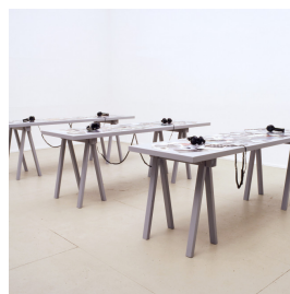
arbeiten Plots 2002, Audioinstallation, Kontributiv, Gesprächsbasiert