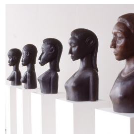
arbeiten StillePost 1999, Installation, Kontributiv, Porträt als Dialog