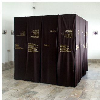
arbeiten Imagine Me 2007, Installation, Kontributiv, Porträt als Dialog