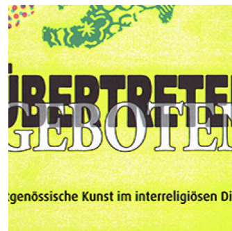
Ausstellungen Übertreten geboten, Zeitgenössische Kunst im interreligiösen Dialog 2010, Gruppenausstellung