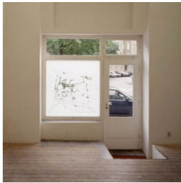
Publikationen Spuren des Sehens 2015, Artikel, Eigene Schrift