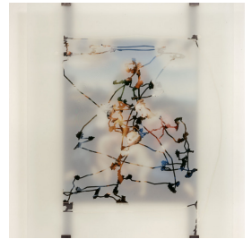
arbeiten trans-parent (Raffael) 1996, Eye-tracking