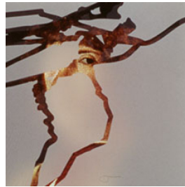
Ausstellungen trans-parent 1998, Einzelausstellung