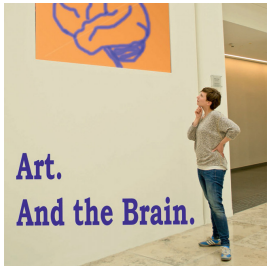
Publikationen In Between Glances 2015, Artikel, Eigene Schrift