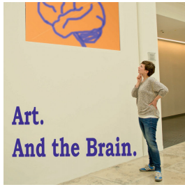
Publikationen In Between Glances 2015, Artikel, Eigene Schrift