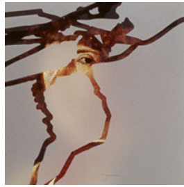
Ausstellungen trans-parent 1998, Einzelausstellung