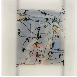
arbeiten trans-parent (Fra Filippo Lippi) 1996, Eye-tracking