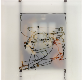
arbeiten trans-parent (Rogier van der Weyden) 1996, Eye-tracking