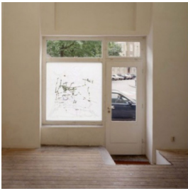
Publikationen Spuren des Sehens 2015, Artikel, Eigene Schrift